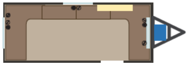
OPCIÓN SIN BAÑO